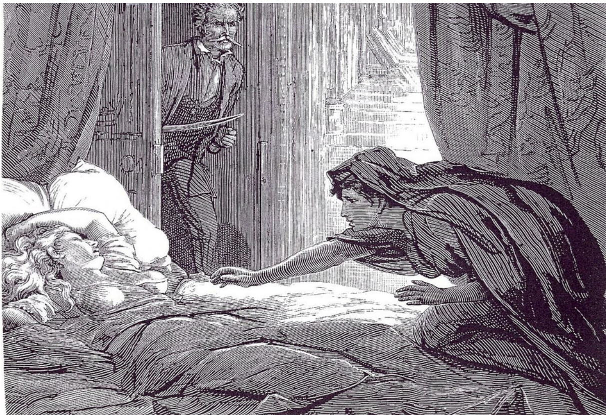
Carmila, David Henry Friston, 1872

¿Qué representa para ti un vampiro? ¿Qué es lo que más te fascina en estas criaturas?