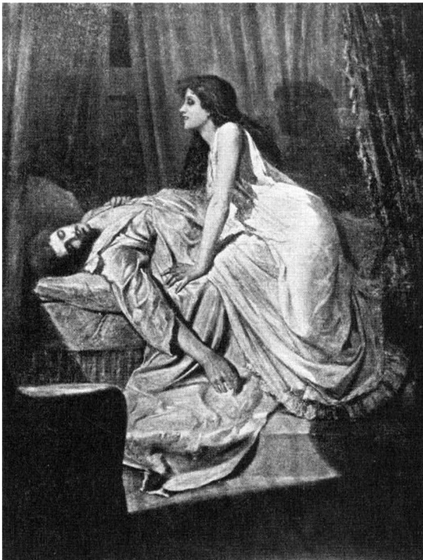
La Vampiro, Philip Burne-Jones, 1897