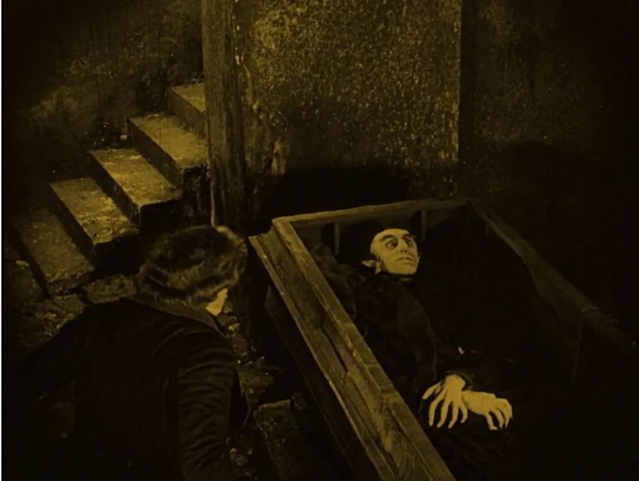
Nosferatu, de F. W. Murnau, 1922.