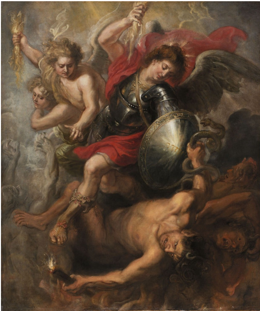
San Miguel expulsando a Lucifer y los ángeles rebeldes, Peter Paul Rubens, 1622

En la mitología cristiana, la lucha entre el bien y el mal nos acompaña desde la creación del hombre. El mal se nos presenta primero como envidia, vanidad, orgullo y soberbia de un ángel, “Lucifer” que es castigado por rebelarse contra Dios, siendo expulsado del cielo. Apartado en el infierno y las tinieblas, con perpetuo dolor y sufrimiento, busca corromper a los humanos, tentándolos. Famosa es la escena de la serpiente corrompiendo a Eva, incitándola a comer el único fruto que estaba prohibido en el paraíso y el comienzo de la tragedia humana, el libre albedrío y con ello, la posibilidad de “hacer el mal”.