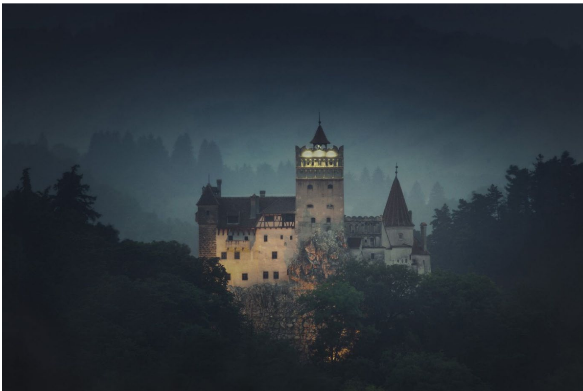
Castillo de Bran, Transilvania, Rumania

“¡El castillo es una verdadera prisión, y yo soy su prisionero!”. Así describe su estancia Harker luego de descubrir que se encuentra solo en un enorme castillo con puertas cerradas. El tiempo se hace eterno y circular. En el caso de Drácula, todo se amplifica, no sabemos cuanto tiempo lleva ahí, recluido y aislado. Se le ve deambular por los alrededores, dirigir a sus lacayos que le han jurado lealtad y mostrarse despectivo con los supersticiosos campesinos. Para él somos marionetas, sirvientes y su presa, no existen iguales. Esto se ve reflejado en las relaciones que establece con quienes ha “infectado”. Drácula es el amo poderoso, que no pertenece ni al cielo ni la tierra, que deambula por ambos, que no tiene un lugar y que desea conocer el nuevo mundo, el lugar donde inicio la revolución industrial, pero que ha cedido terreno a su antigua colonia, ocupando su lugar en la economía mundial. Drácula lleva tiempo planeando este viaje y más adelante sabremos que posee 50 propiedades en Londres. Al igual que Quincey Morris, es el extranjero que capitaliza su riqueza, “estoy seguro que si me muevo y hablo en Londres, todos me reconocerían como un extranjero”.